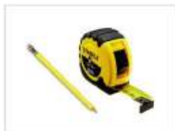
Рулетка и карандаш