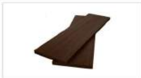
Подступенок/доска заборная 140x12