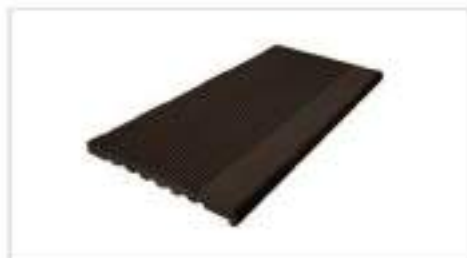
Ступень 345x23; L=3м; 4м